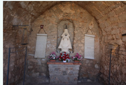
Ermita del Despeñadero

ERMITA DEL DESPEÑADERO . Se sitúa en el extremo sureste del patio de armas. Se trata de una pequeña construcción, realizada en mampostería 10 , de cubierta abovedada, y que por el mortero del revoco documentado en alguna de sus caras posee un claro origen medieval. Presenta varias modificaciones, entre ellas, el sellado de lo que debió ser una puerta en el lado norte. Su funcionalidad original nos es desconocida, aunque debió ser de tipo militar, si bien ésta ya había cambiado en el s. XVII, ya que algunas fuentes de esta época nos hablan de su uso como ermita, antes de haberse realizado la construcción del actual santuario.