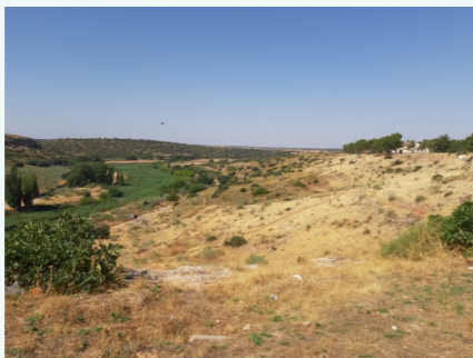
Camino Medieval, “M”.

En el punto en que nos encontramos, entroncaría con el foso, el cual sería salvado con algún tipo de estructura realizada en madera, fácilmente desmontable.