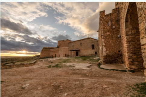
Patio de armas, desde diferentes perspectivas.

ERMITA DEL DESPEÑADERO . Se sitúa en el extremo sureste del patio de armas. Se trata de una pequeña construcción, realizada en mampostería 10 , de cubierta abovedada, y que por el mortero del revoco documentado en alguna de sus caras posee un claro origen medieval. Presenta varias modificaciones, entre ellas, el sellado de lo que debió ser una puerta en el lado norte. Su funcionalidad original nos es desconocida, aunque debió ser de tipo militar, si bien ésta ya había cambiado en el s. XVII, ya que algunas fuentes de esta época nos hablan de su uso como ermita, antes de haberse realizado la construcción del actual santuario.