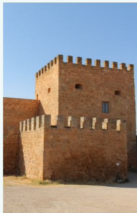
Torre del Homenaje

Poseía tres plantas, siendo el cuerpo superior una recreación actual. Ha sufrido varias remodelaciones, entre las que cabe indicar la ventana existente en su cara norte, realizada durante los s. XVI o XVII, y las cañoneras situadas sobre ella, realizadas durante el s. XIX con motivo de las guerras carlistas.