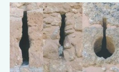
Aspillera 19 , saetera y tronera